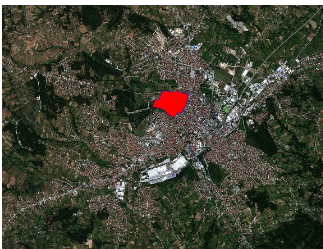
Слика бр. 1. Положај обухвата плана у односу на урбано подручје града Крагујевца

Измене и допуне Плана генералне регулације „Насеља Вашариште“ у Крагујевцу обухватају подручје од око 75,5 ha у широј централној зони града и усклађене су са Генералним урбанистичким планом „Крагујевац 2030“. План има за циљ унапређење просторне организације, дефинисање правила грађења и усклађивање јавног и приватног интереса, уз посебан акценат на инфраструктуру, саобраћај и квалитет живота. Такође, предвиђа рационалније коришћење простора и даљи развој насеља у складу са растом становништва и постојећим урбаним потенцијалима и ограничењима.